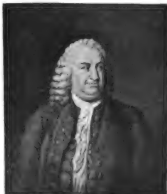
Albrecht von Haller.

(Botanik, Anatomie, Chirurgie), sowie Ausgaben von Klassikern. — Die « Elementa physiologiae » sind die erste systematische, auf eigene Experimente des Verfassers gegründete und die gesamte bisher vorliegende Litteratur erschöpfende Darstellung des Inhaltes der Physiologie. Am meisten ragen darin die Untersuchungen über